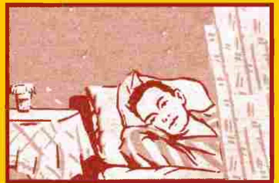
Избегайте контактов с заболевшими