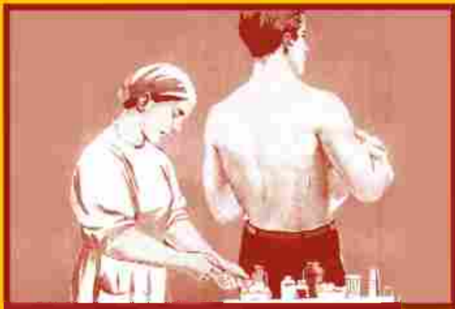
Сделайте прививку от гриппа