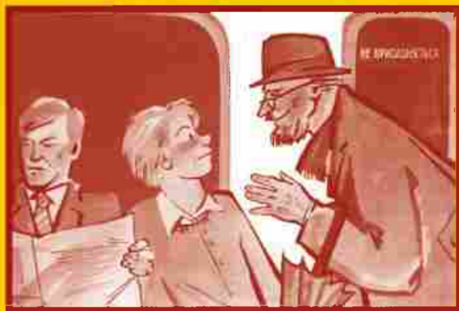
Ограничьте пребывание в местах скопления людей