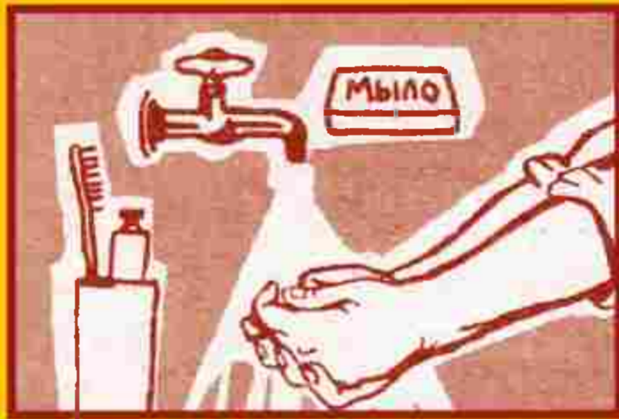
Регулярно мойте руки