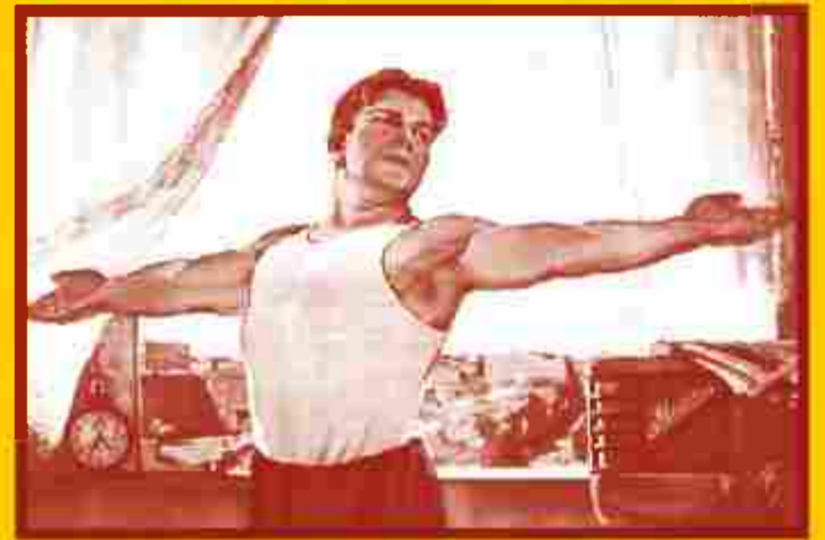
Ведите здоровый образ жизни